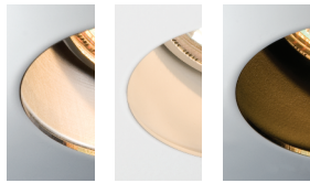
SAA WH BLK